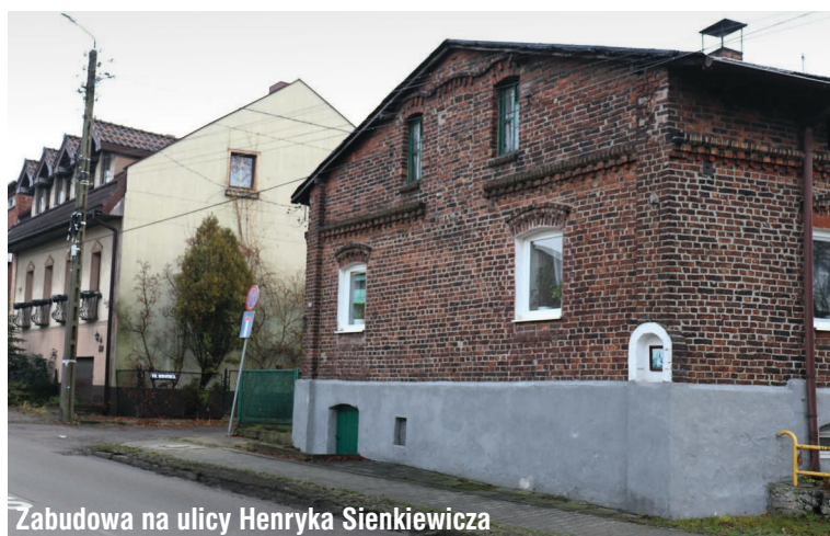
Zabudowa na ulicy Henryka Sienkiewicza

z czerwonej cegły elewacyjnej, nawiązujące do tradycyjnego budownictwa robotniczego. Nieco dalej, przy ulicy Sienkiewicza 163, usytuowany jest modernistyczny budynek Szkoły Podstawowej im. Tadeusza Kościuszki, którego historia sięga 1938 roku. Powstał on z inicjatywy ówczesnego grona nauczycielskiego i mieszkańców wioski na tzw. Karczmarzówce. Do czasu wybuchu II wojny światowej wykonano fundamenty, a budowę zakończono w 1949 roku. Po przeciwnej stronie ulicy, przy numerze 164, dostrzec można małą, wkomponowaną w ogrodzenie, kapliczkę, pochodzącą z początku XIX wieku. Pierwotnie w jej wnętrzu znajdowała się figura św. Jana Nepomucena, dzisiaj ustawiona jest tam figura Matki Bożej.