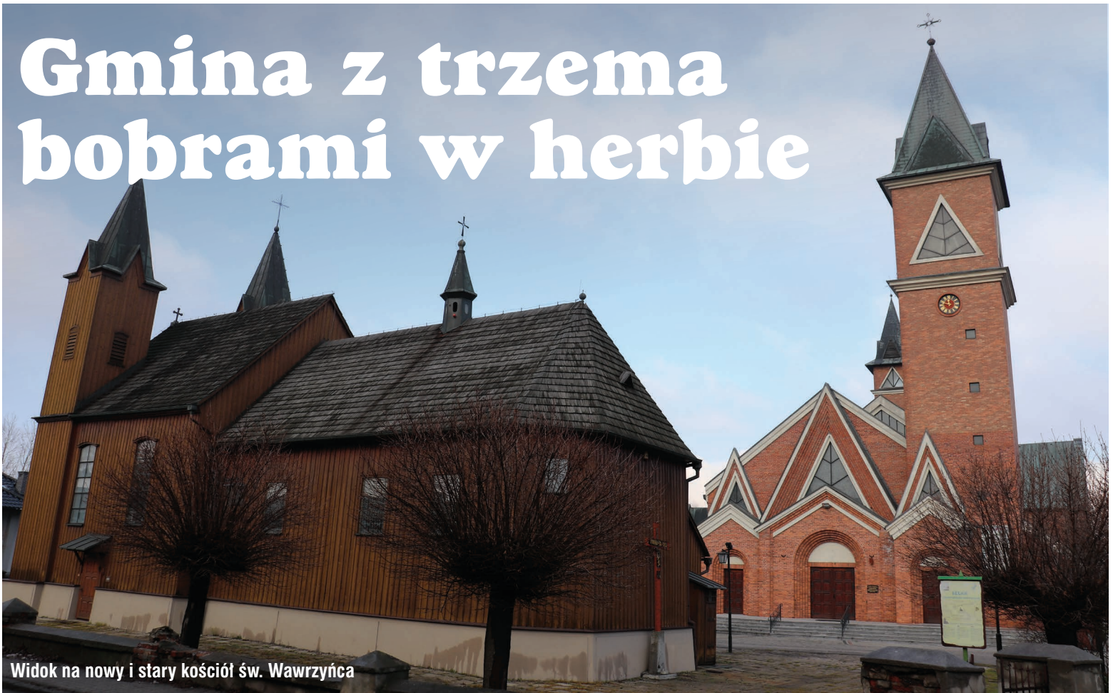
Widok na nowy i stary kościół św. Wawrzyńca

Bobrowniki to gmina wiejska leżąca w powiecie będzińskim, jej zachodnia granica (z Piekarami Śląskimi) przebiega wzdłuż Brynicy. Początki wsi sięgają XI wieku, a lokacja datowana jest na 1273 rok.