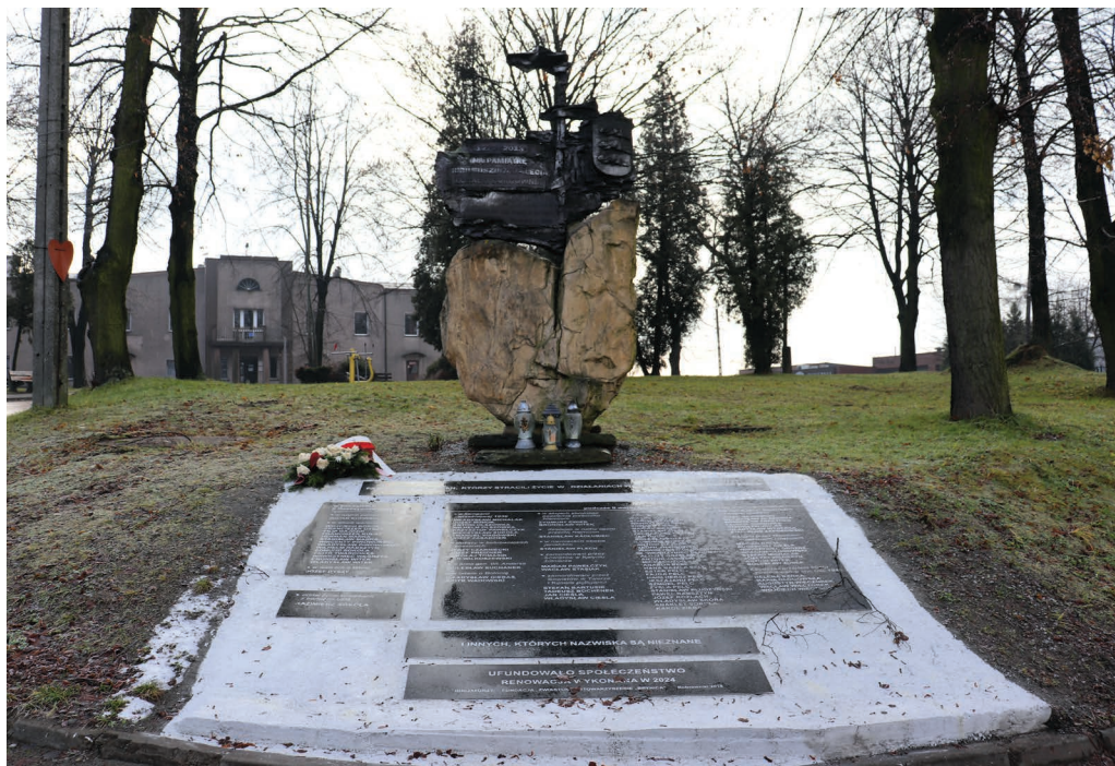
Pomnik upamiętniający 740-lecie Bobrownik

Tekst i zdjęcia: Adam Lapski Przewodnik turystyczny