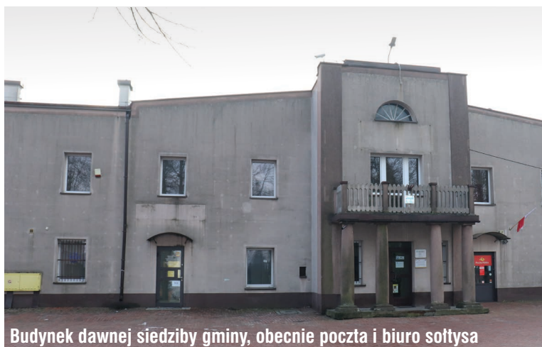
Budynek dawnej siedziby gminy, obecnie poczta i biuro softysa