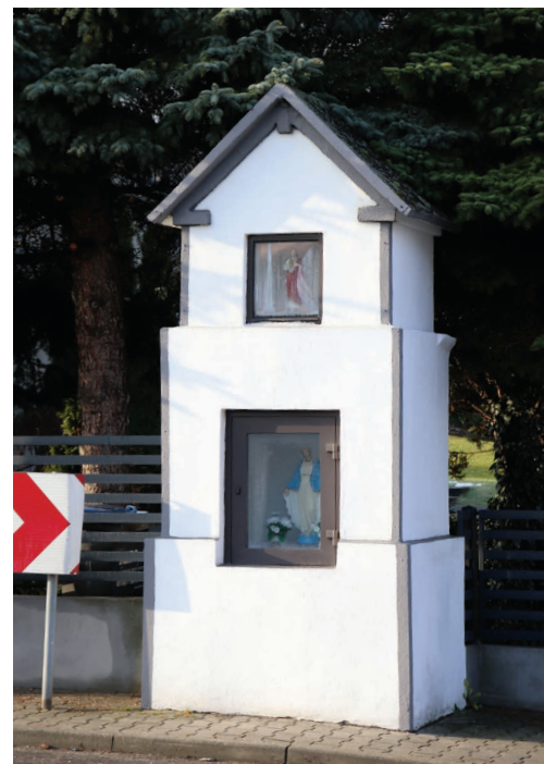
Kapliczka u zbiegu ulic 1 Maja i Sienkiewicza