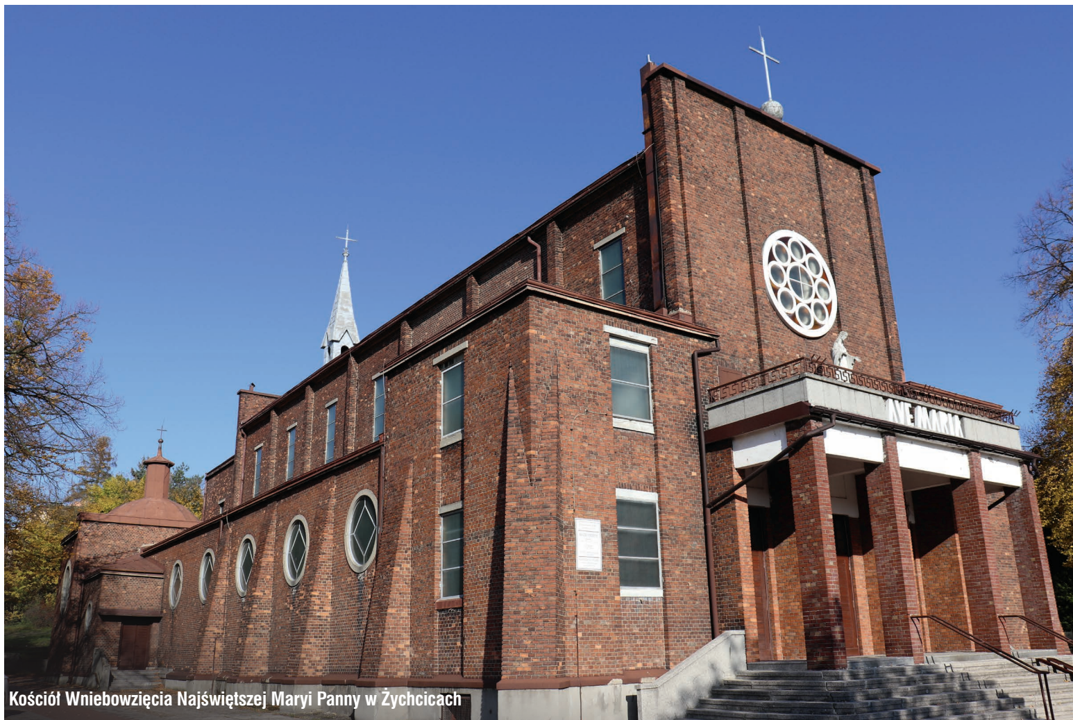
Kościół Wniebowzięcia Najświętszej Maryi Panny w Żychcicach

Pierwsza wzmianka o Wojkowicach Komornych (obecnych Wojkowicach) pochodzi już z 1254 roku. Od XIV wieku wieś znajdowała się w granicach Księstwa Siewierskiego i należała do dóbr biskupów krakowskich. Takie były początki tej miejscowości, a przez kolejne wieki historia Wojkowic wzbogacała się o kolejne ciekawe rozdziały.