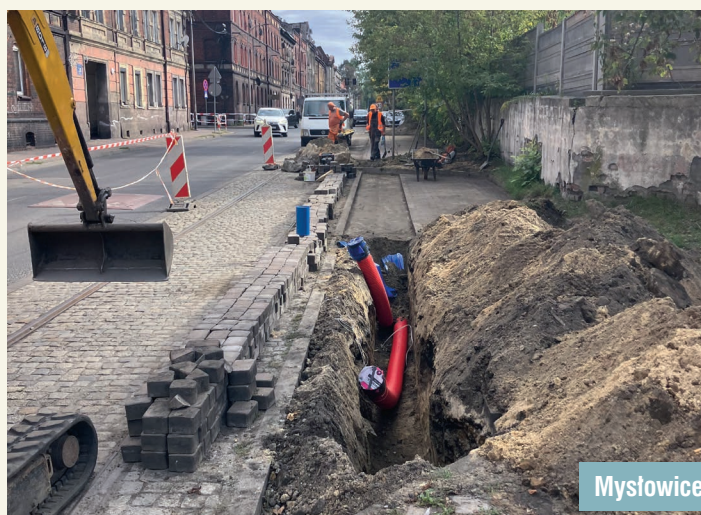
Mysłowice, ul. Świerczyny

W związku z realizacją zadań inwestycyjnych nr 2.4 pn. „Przebudowa infrastruktury tramwajowej w ciągu ul. Wojska Polskiego w Sosnowcu, od ul. Gen. Andersa do ul. Orłąt Lwowskich (dobudowa drugiego toru)” oraz nr 10 pn. „Modernizacja infrastruktury torowo – sieciowej na linii tramwajowej nr 14 w Mysłowicach w ciągu ulic: Bytomska, Starokościelna, Szymanowskiego, Powstańców” dofinansowanych ze środków Unii Europejskiej, Spółka przystąpiła do realizacji zadań dodatkowych finansowanych środkami własnymi. Obecnie trwa przebudowa torowiska tramwajowego i sieci trakcyjnej na odcinku około 750 metrów, łączącym zadania nr 2.4. i 10. W ramach zadania przystąpiono również do kompleksowej modernizacji obiektu mostowego na granicy Mysłowic i Sosnowca. Szacunkowy koszt zadania to 7.500.000 zł netto. Jednocześnie, w związku z planowaną przez Urząd Miasta w Mysłowicach przebudową obiektu mostowego na ul. Świerczyny, przystąpiono do modernizacji infrastruktury tramwajowej wzdłuż tej ulicy. Aktualnie Spółka realizuje dwa zadania inwestycyjne. Pierwsze zadanie polega na modernizacji sieci trakcyjnej i kabli zasilających na odcinku od ul. Bytomskiej do ul. Obrzeźnej Północnej o długości około 650 m. Drugie zadanie dotyczy modernizacji torowiska tramwajowego na długości około 700 m wraz z siecią trakcyjną o długości około 1000 m i kabli zasilających na odcinku od ul. Obrzeźnej Północnej do granicy Miasta. Szacunkowy koszt zadań to 9.000.000 zł netto.