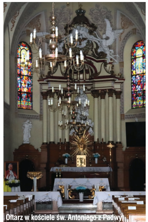
Ołtarz w kościele św. Antoniego z Padwy