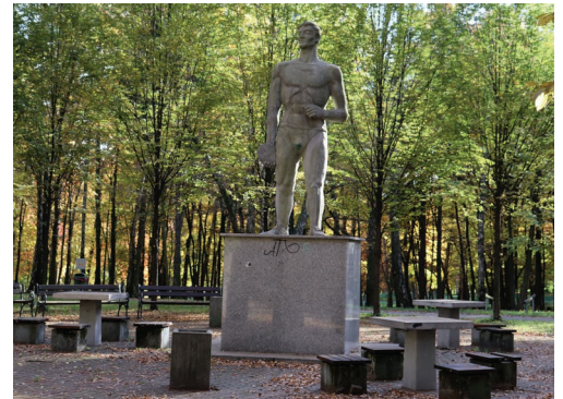
Rzeźba Dyskobola w wojkowickim Parku Miejskim