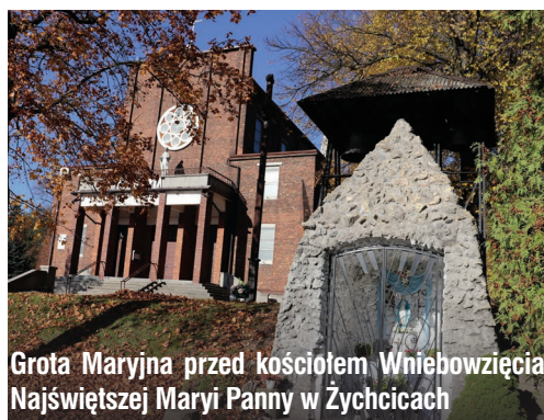
Grota Maryjna przed kościołem Wniebowzięcia Najświętszej Maryi Panny w Żychcicach