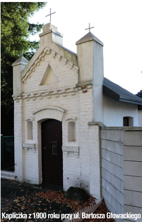
Kapliczka z 1900 roku przy ul. Bartosza Głowackiego

Tekst i zdjęcia: Adam Lapski Przewodnik turystyczny