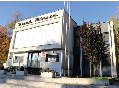
Budynek Urzędu Miasta w Wojkowicach

Mieszkańcy po raz pierwszy mogli załatwić tu swoje urzędowe sprawy w 1993 roku. Osiem lat później budynek gruntownie przebudowano i wyremontowano, dostosowując go do aktualnych potrzeb pracowników i mieszkańców Wojkowic. Po lewej stronie wojkowickiego ratusza znajduje się duże koło maszyny wyciągowej (o średnicy 5 metrów i wadze 7 ton), które ustawiono w „Hołdzie represjonowanym politycznie żołnierzom – górnikom, którzy przymusowo pracowali i ginęli w KWK Wojkowice w latach 1949-1959, a także w 50-lecie nadania praw miejskich Wojkowicom”. Koło jest darem Kompanii Węglowej w Katowicach i pochodzi z kopalni „Andaluzja” z Piekar Śląskich.