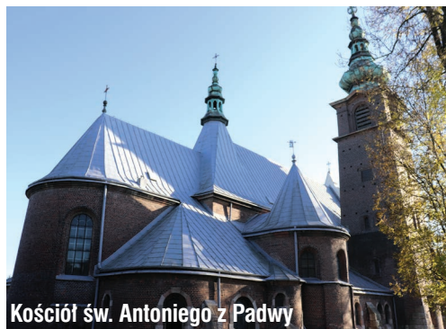
Kościół św. Antoniego z Padwy