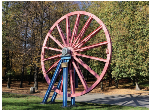
Koło kopalnianej maszyny wyciągowej

Po wyjściu z Parku Miejskiego udajemy się do ulicy Pląka, a następnie w stronę ulicy Bartosza Głowackiego, gdzie pod numerem 126 zobaczymy białą ceglano-