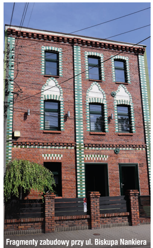
Fragmenty zabudowy przy ul. Biskupa Nankera