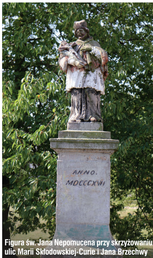
Figura św. Jana Nepomucena przy skrzyżowaniu ulic Marii Skłodowskiej-Curie i Jana Brzechwy