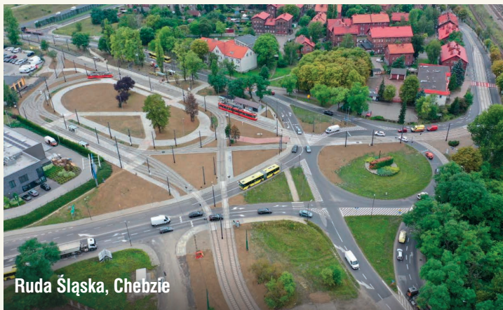
Ruda Śląska, Chebzie