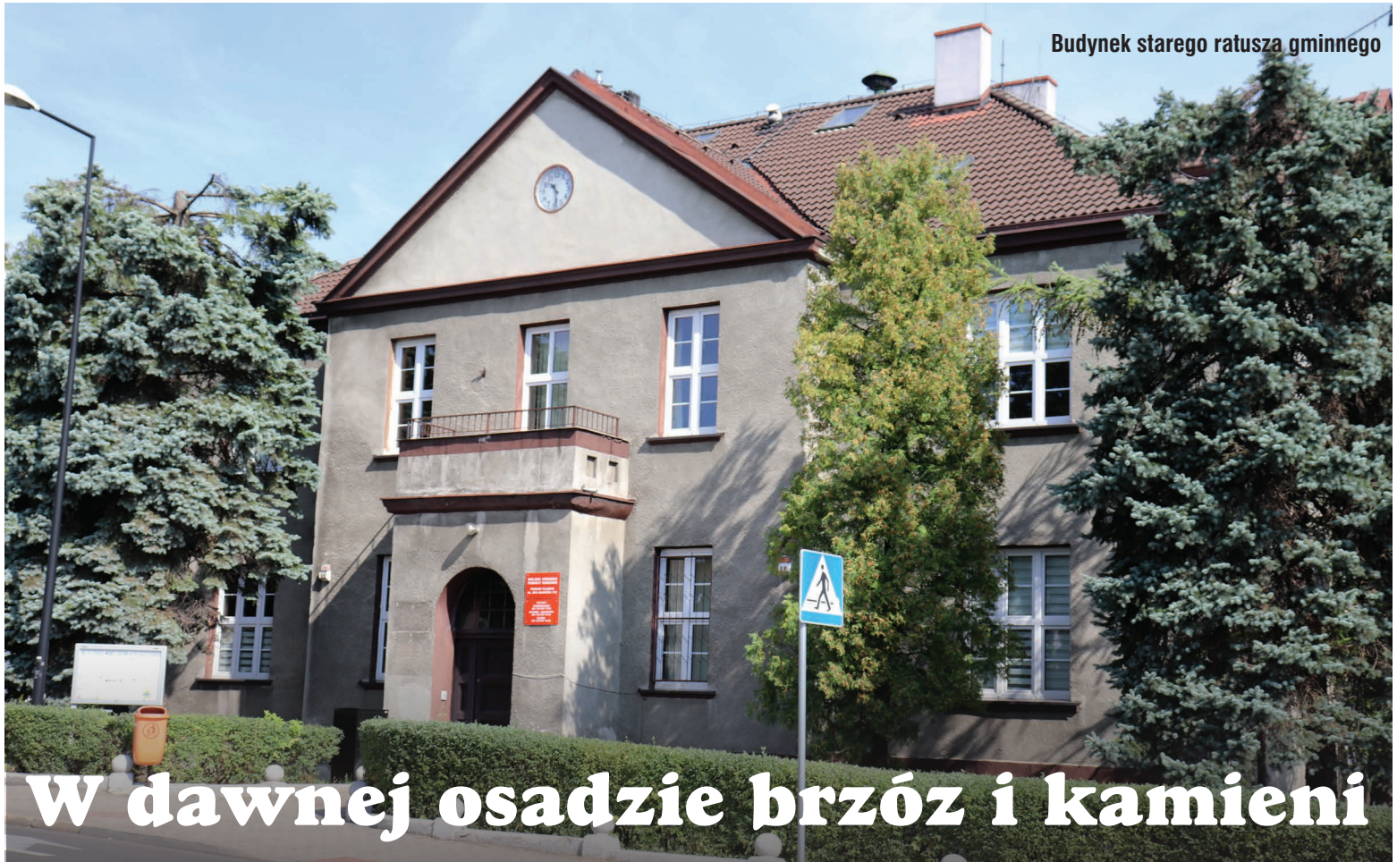
Budynek starego ratusza gminnego

W ramach cyklu artykułów, który zatytułowaliśmy „Spacery po regionie”, zachęcamy do wspólnych wędrówek ścieżkami Śląska i Zagłębia Dąbrowskiego. Są to wyprawy niezwykle - odwiedzimy interesujące miejsca i obiekty, które znajdują się blisko nas, po sąsiedzku albo nawet w naszym mieście, a dla wielu wciąż pozostają nieznanne.