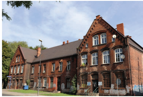
Dawna szkoła ludowa przy ul. Oświęcimskiej 1

Z ulicy Jana Brzechwy udajemy się do ulicy Biskupa Nankera, gdzie znajduje się monumentalny kościół parafialny pw. Świętych Apostołów Piotra i Pawła. Jest to świątynia najstarszej piekarskiej parafii, wzmiankowanej już w 1277 roku, kiedy to odłączyła się od bytomskiej parafii św. Małgorzaty. Obecny kościół stanął na fundamentach dawnej gotyckiej świątyni. Zbudowany został w latach 1898-1899 z czerwonej cegły elewacyjnej według projektu Ludwiga Schneidera. Jest to budowla w stylu neogotyckim, trójnawowa, z mierzącą 70 metrów strzelistą wieżą. Nawa główna ma sklepienie gwieździste, zaś nawy