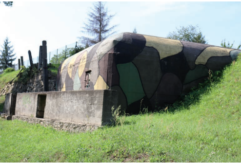
Polski Schron Bojowy nr 50 przy ul. Partyzantów

żołnierzy, zaopatrzonych w dwa karabiny maszynowe. Obecnie jest to udostępniona do zwiedzania Izba Muzealna Obszaru Warownego „Śląsk” prowadzona przez Stowarzyszenie na Rzecz Zabytków Fortyfikacji „Pro Fortalicium”.