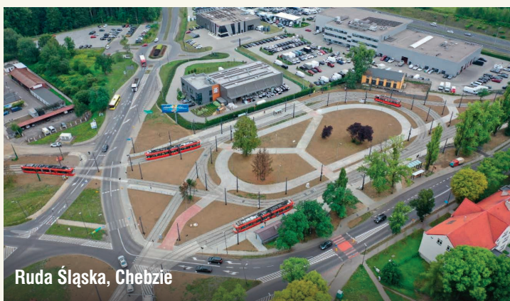
Ruda Śląska, Chebzie