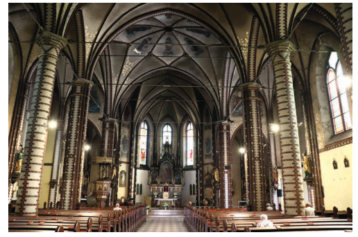
Wnętrze kościoła pw. Świętych Apostołów Piotra i Pawła

Ulicą Oświęcimską dochodzimy do Ośrodka Kultury „Andaluzja”. Przed budynkiem w 2019 roku postawiono pomnik upamiętniający pracowników Kopalni Węgla Kamiennego „Andaluzja”,