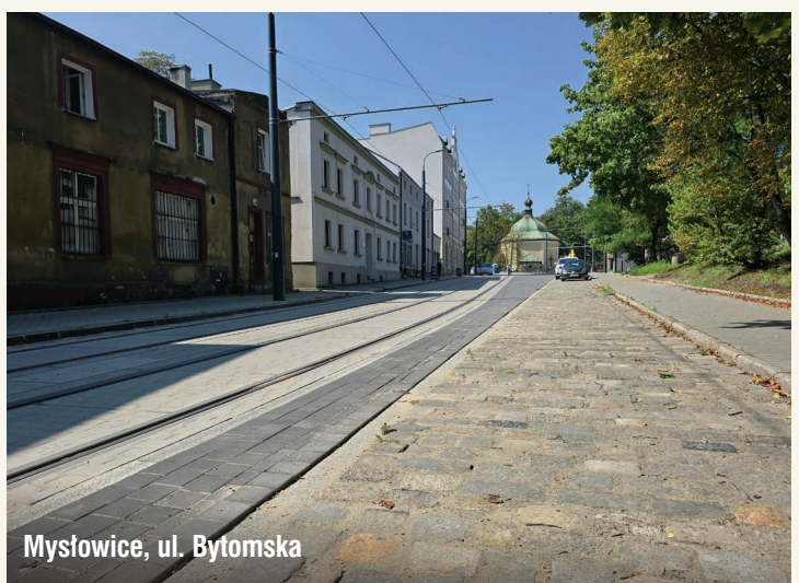
Mysłowice, ul. Bytomska

Wszystkie wymienione w tekście inwestycje, związane są z Projektem pn.: „Zintegrowany Projekt modernizacji i rozwoju infrastruktury tramwajowej w Aglomeracji Śląsko-Zagłębiowskiej wraz z zakupem taboru tramwajowego” współfinansowanym przez Unię Europejską ze środków Funduszu Spójności w ramach Programu Operacyjnego Infrastruktura i Środowisko w perspektywie UE 2014-2020.