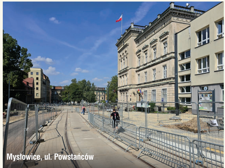
Mysłowice, ul. Powstańców