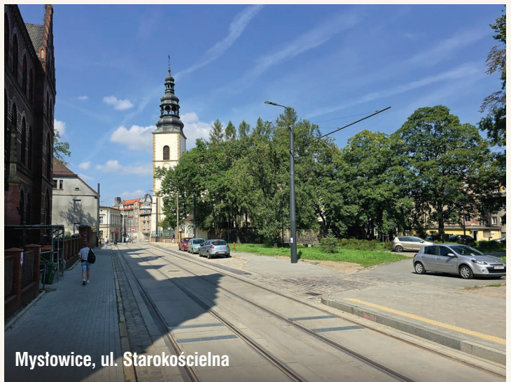
Mysłowice, ul. Starokościelna