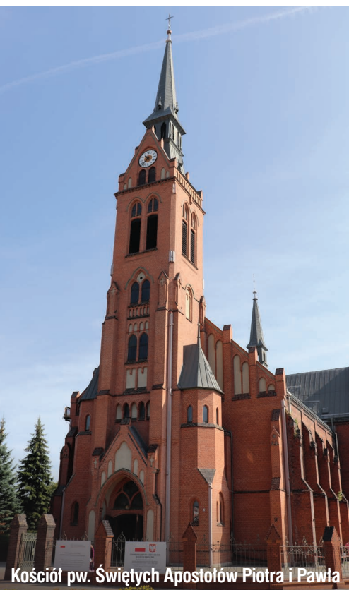
Kościół pw. Świętych Apostołów Piotra i Pawła

Tekst i zdjęcia: Adam Lapski Przewodnik turystyczny