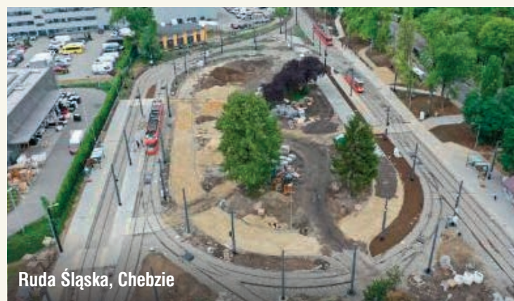
Ruda Śląska, Chebzie

Wszystkie wymienione w tekście inwestycje, związane są z Projektem pn.: „Zintegrowany Projekt modernizacji i rozwoju infrastruktury tramwajowej w Aglomeracji Śląsko-Zagłębiowskiej wraz z zakupem taboru tramwajowego” współfinansowanym przez Unię Europejską ze środków Funduszu Spójności w ramach Programu Operacyjnego Infrastruktura i Środowisko w perspektywie UE 2014-2020.