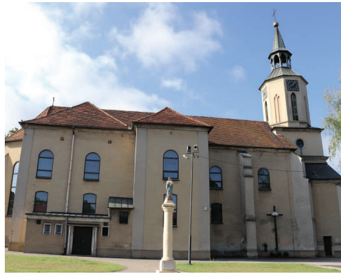
Kościół św. Mikołaja

Kolejne kroki kierujemy w stronę ulicy Księcia Józefa Poniatowskiego. U zbiegu z ulicą Osiedlową zobaczymy zabytkowy budynek z czerwonej cegły z końca XIX wieku, w którym działa Zespół Szkół Specjalnych. Idąc dalej tą samą ulicą dojrzymy do placu przy kościele pw. św. Mikołaja, na którym stoi kolumna Maryjna z 1919 roku. Oczywiście warto udać się do samej świątyni, która ma niezwykle ciekawą i długą historię. Kościół był wspominany w dokumentach już w 1256 roku, a jego pierwotnym patronem był św. Paweł (natomiast św. Mikołaj patronuje kościołowi od 1412 roku). W 1450 roku stara drewniana świątynia zastąpiona została murowaną, w stylu gotyckim. W latach 1560-1627 kościół był w rękach protestantów. Budynek został zniszczony podczas wspomnianego już wielkiego pożaru miasta w 1822 roku. Po tym wydarzeniu kościół odrestaurowano, zmieniając jego wystrój na barokowy, pozostawiając jednak elementy neogotyckie. Pozostałości kościoła z XV wieku znajdziemy pomiędzy ołtarzem głównym a amboną. Z pożogi pożaru uratowano jedynie ołtarz św. Jana Nepomucena z XVI wieku, reszta to sprzęty z czasów odbudowy. Do innych zabytkowych części wyposażenia kościoła należą: drewniany ołtarz główny z centralnie ustawioną figurą patrona kościoła w otoczeniu Apostołów św. Piotra i św. Pawła, ambona, krzyż