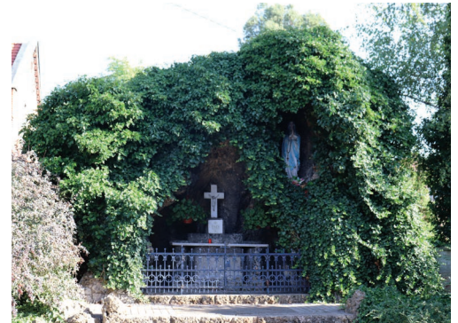
Grota Matki Boskiej z Lourdes przed kościołem św. Mikołaja

z relikwiami św. Wincentego z 1370 roku, chrzcielnica w kaplicy św. Anny, a także obrazy doktorów Kościoła: św. Ambrożego, Hieronima, Augustyna i Grzegorza Wielkiego. W 1823 roku do bryły kościoła dobudowana została kościelna wieża wysoka na 45 metrów. Warto zwrócić uwagę na stojącą przed kościołem grootę matki Bożej z Lourdes z 1909 roku, Ogrójec z 1863 roku, a także trzy skalne groty wkomponowane w ogrodzenie kościoła. Wychodząc z kościoła możemy odpocząć w jednym z miejskich parków: Jordanowskim oraz im. Józefa Piłsudskiego. W tym drugim, oprócz pomnika ku czci poległych za obronę Ojczyzny, znajduje się tężnia solankowa. Nieopodal, na ulicy Armii Krajowej, podziwiać można ciekawą zabudowę mieszkalną, zaś na niewielkim wzgórzu - kościółek pw. św. Stanisława. Pierwsza wzmianka o tej świątyni pochodzi z 1447 roku i związana jest z założeniem w jego sąsiedztwie przytułku, a także wcześniejszej obecności w Pyskowicach św. biskupa Stanisława. Kościółek był wówczas szpitalną kaplicą. Obecny obiekt wzniesiony w stylu neogotyckim pochodzi z lat 1865-1868. Tuż pod wzgórzem, od strony ulicy Cmentarnej, znajduje się cmentarz parafialny. Idąc wzdłuż nekropolii docieramy w obszar Parku Miejskiego i do nietypowej kładki, która jest