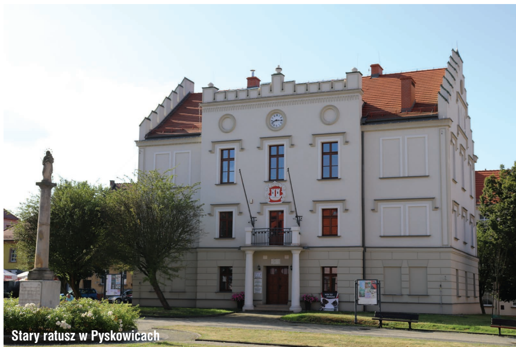
Stary ratusz w Pyskowicach

Pyskowice to jedno z tych niewielkich miast, które po-szczycić się mogą bogatą historią, sięgającą aż średniowiecza. Dawna osada powstała w XIII wieku, na szlaku handlowym z Wrocławia przez Opole i Bytom do Krakowa. Pyskowice lokowane były na prawie magdeburskim przez księcia opolskiego Władysława I około 1250 roku.