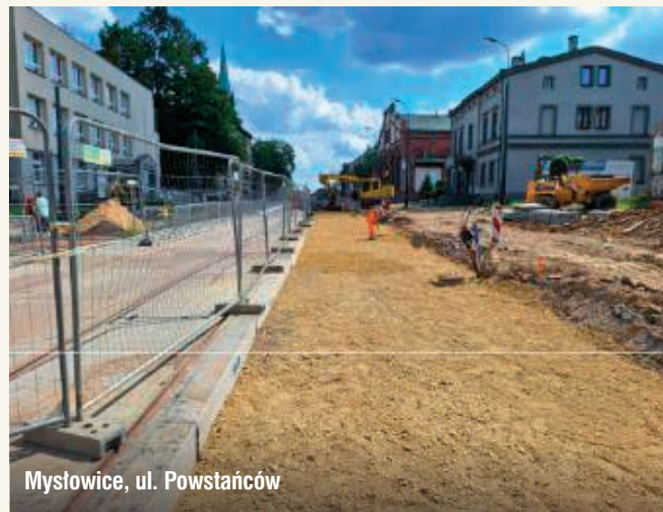
Mysłowice, ul. Powstańców