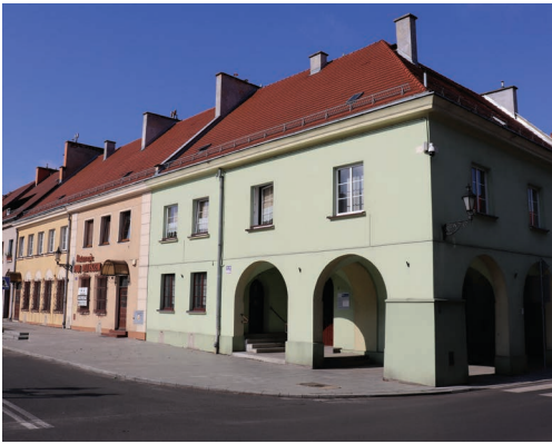
Rynkowe kamieniczki z XVIII i XIX wieku

Kolejne kroki kierujemy w stronę ulicy Księcia Józefa Poniatowskiego. U zbiegu z ulicą Osiedlową zobaczymy zabytkowy budynek z czerwonej cegły z końca XIX wieku, w którym działa Zespół Szkół Specjalnych. Idąc dalej tą samą ulicą dojrzymy do placu przy kościele pw. św. Mikołaja, na którym stoi kolumna Maryjna z 1919 roku. Oczywiście warto udać się do samej świątyni, która ma niezwykle ciekawą i długą historię. Kościół był wspominany w dokumentach już w 1256 roku, a jego pierwotnym patronem był św. Paweł (natomiast św. Mikołaj patronuje kościołowi od 1412 roku). W 1450 roku stara drewniana świątynia zastąpiona została murowaną, w stylu gotyckim. W latach 1560-1627 kościół był w rękach protestantów. Budynek został zniszczony podczas wspomnianego już wielkiego pożaru miasta w 1822 roku. Po tym wydarzeniu kościół odrestaurowano, zmieniając jego wystrój na barokowy, pozostawiając jednak elementy neogotyckie. Pozostałości kościoła z XV wieku znajdziemy pomiędzy ołtarzem głównym a amboną. Z pożogi pożaru uratowano jedynie ołtarz św. Jana Nepomucena z XVI wieku, reszta to sprzęty z czasów odbudowy. Do innych zabytkowych części wyposażenia kościoła należą: drewniany ołtarz główny z centralnie ustawioną figurą patrona kościoła w otoczeniu Apostołów św. Piotra i św. Pawła, ambona, krzyż