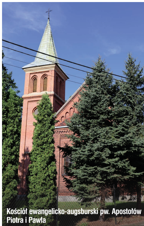
Kościół ewangelicko-augsburski pw. Apostołów Piotra i Pawła