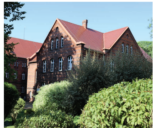
Zespół Szkół im. Marii Konopnickiej

Tekst i zdjęcia: Adam Lapski Przewodnik turystyczny