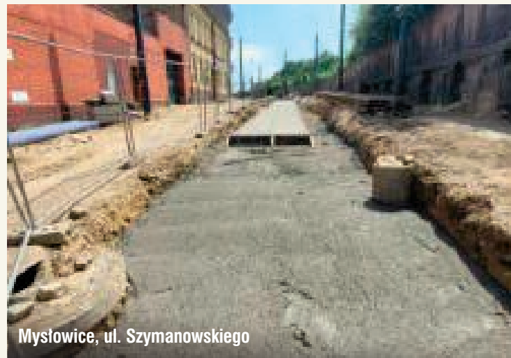
Mysłowice, ul. Szymanowskiego