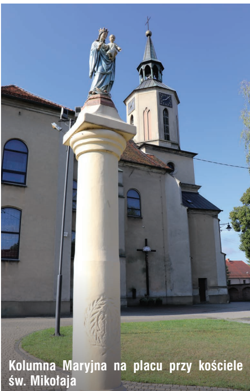
Kolumna Maryjna na placu przy kościele św. Mikołaja