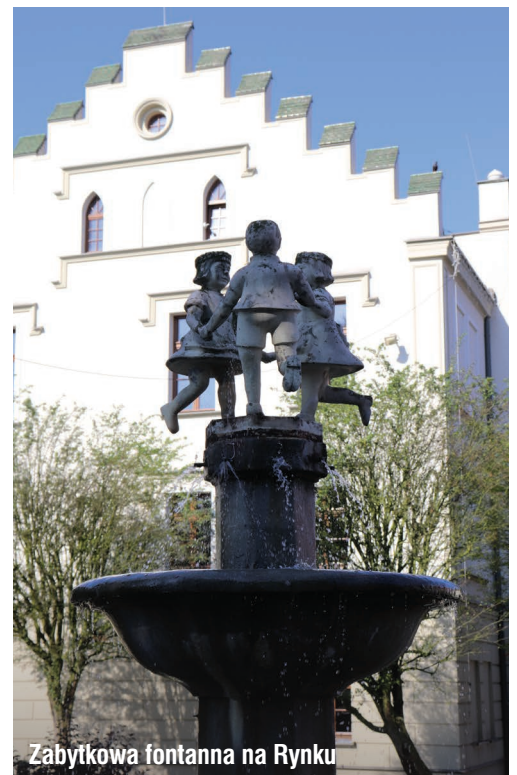
Zabytkowa fontanna na Rynku