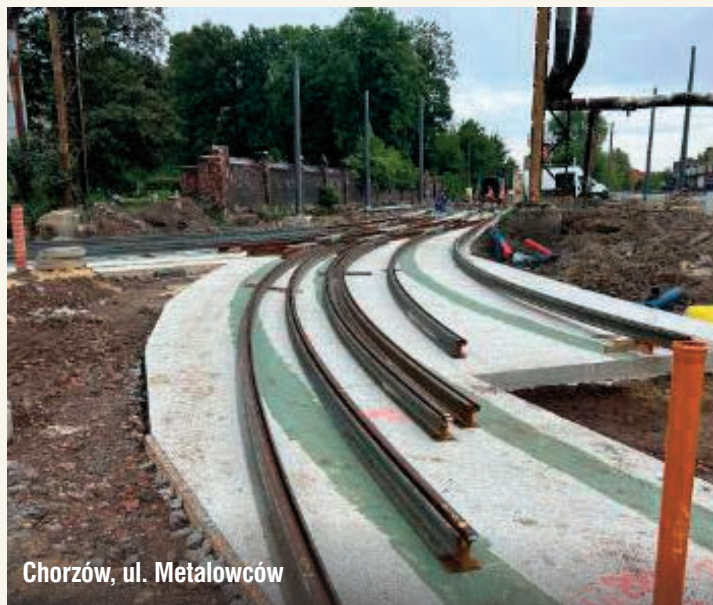
Chorzów, ul. Metalowców