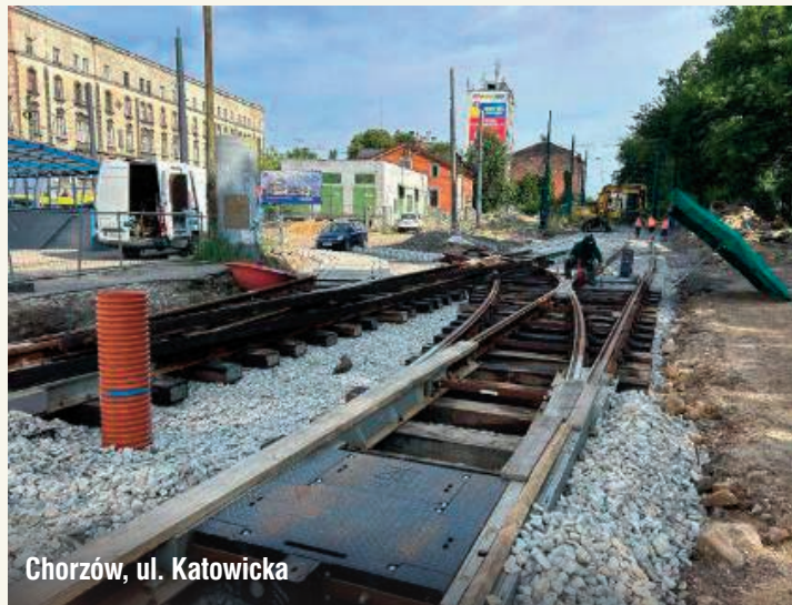
Chorzów, ul. Katowicka