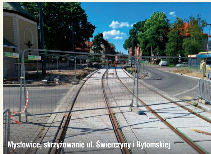
Mysłowice, skrzyżowanie ul. Świerczyny i Bytomskiej