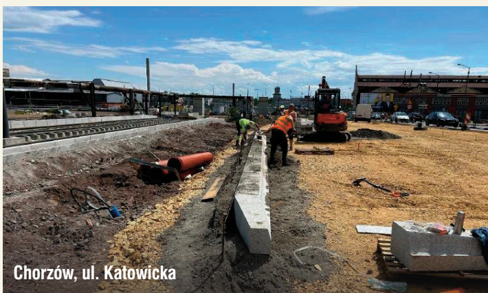
Chorzów, ul. Katowicka