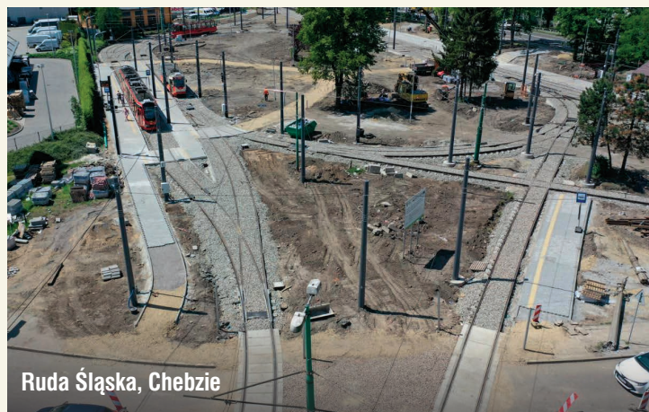
Ruda Śląska, Chebzie