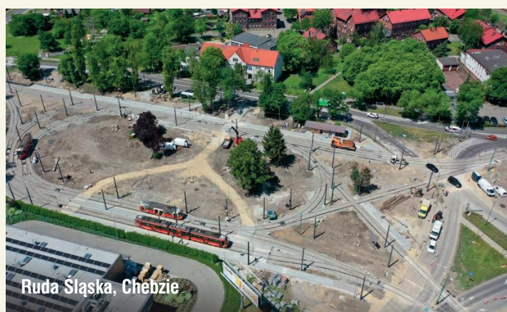
Ruda Śląska, Chebzie

Wszystkie wymienione w tekście inwestycje, związane są z Projektem pn.: „Zintegrowany Projekt modernizacji i rozwoju infrastruktury tramwajowej w Aglomeracji Śląsko-Zagłębiowskiej wraz z zakupem taboru tramwajowego” współfinansowanym przez Unię Europejską ze środków Funduszu Spójności w ramach Programu Operacyjnego Infrastruktura i Środowisko w perspektywie UE 2014-2020.