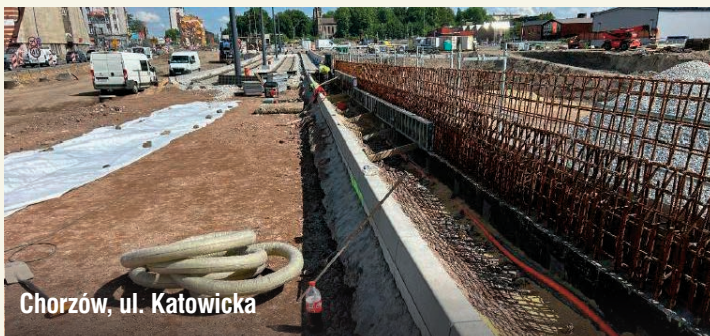
Chorzów, ul. Katowicka